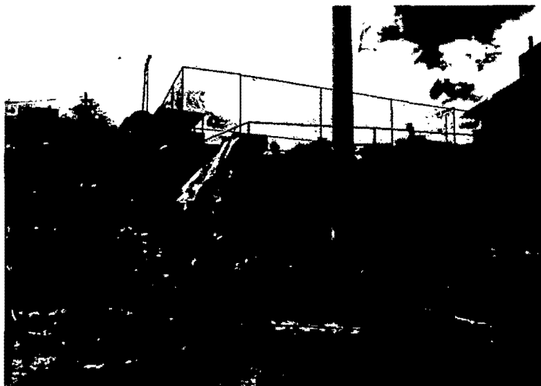
Foto 5.2 - Vista do campo em direção à Rua Edmeire Pacheco